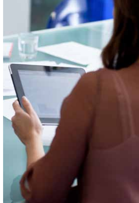
Abbildung 1. Portfolio der Alcatel-Lucent OpenTouch™ Suite für KMU

Das Portfolio ist zuverlässig, offen und basiert auf Standards. Die Alcatel-Lucent OpenTouch™ Suite für KMU ist auf allen Ebenen modular – von Kommunikationspaketen und Softwarelizenzen bis hin zu Kommunikations-Servern und Netzwerk-Infrastrukturen, die die Anforderungen der Kunden genau erfüllen. Sie können dieses Portfolio mit einer Hardwaregarantie und zahlreichen Leistungen erwerben: vom einfachen Wartungsvertrag bis zur kompletten Systemaufrüstung für neue Anwendungen und Technologien. Die Alcatel-Lucent OpenTouch™ Suite für KMU ist zukunftsorientiert, basiert auf einem leistungsstarken und flexiblen IP-Kommunikations-Server mit Standardprotokollen, der OmniPCX™ Office Rich Communication Edition (RCE), und bietet eine Reihe leistungsfähiger Merkmale.